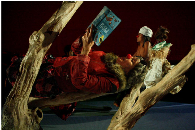
Performance: The Tree Director: Eugenio Barba

El Odin Teatret con dirección de su fundador, Eugenio Barba , lleva 54 años recorriendo mundo. Desde su sede en Holstebro, Dinamarca, sus espectáculos son recibidos lo mismo en cualquier país de Hispanoamérica que en Nueva Delhi, ciudades de China o en un Festival de teatro en Alemania. ¿Qué tienen sus funciones para arraigar de tal manera en culturas tan distintas? Lo mismo que El árbol que ahora se presenta en Madrid: el dominio de un lenguaje universal que aglutina lenguas diversas, actores de distinta disciplina y origen étnico, y una gran vocación de solidaridad. Una ceremonia en torno a la violencia del negocio de la guerra sobre los inocentes que la padecen.