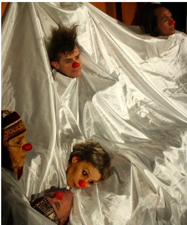
ODIN TEATRET ARCHIVES Performance: The Tree Director: Eugenio Barba Photo: Rina Skeel

En El árbol , personajes específicos de culturas determinadas se enfrentan o alían, según convenga, en un