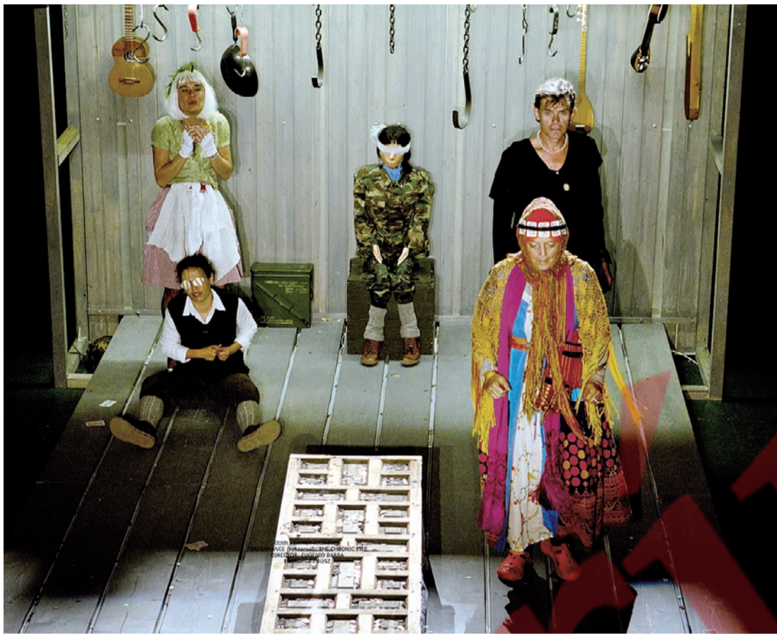
Una escena de "La vida crónica", que delata el drama de la inmigración.