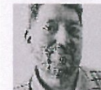
GERT PODER ANMELDER

På scenegulvet ligger et lig i uniform, en dukke, men det kunne være en krop. Imens fortsætter livet. Året er 2031, og de efterladte begraver ofrene efter Europas Tredje Borgerkrig.